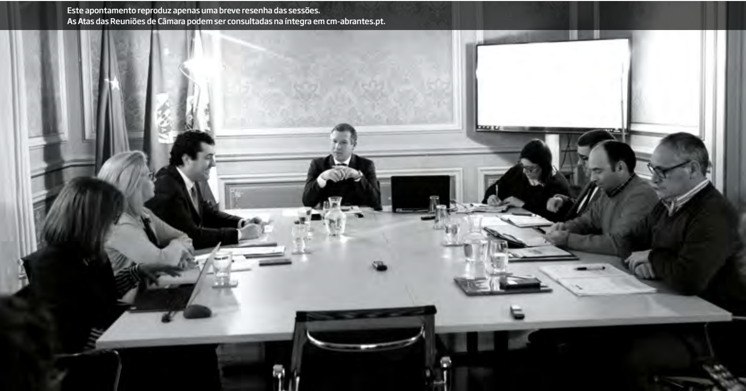
Este apontamento reproduz apenas uma breve resenha das sessões. As Atas das Reuniões de Câmara podem ser consultadas na íntegra em cm-abrantes.pt .

Pode também fazer o seu registo em www.cm-abrantes.pt