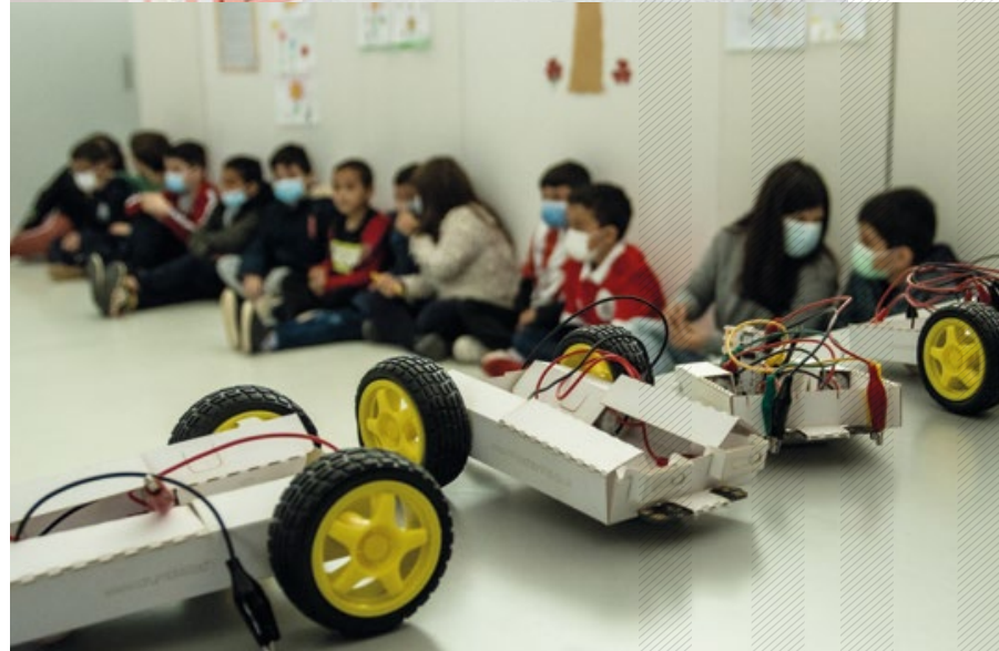
↑ Projeto T-CODE