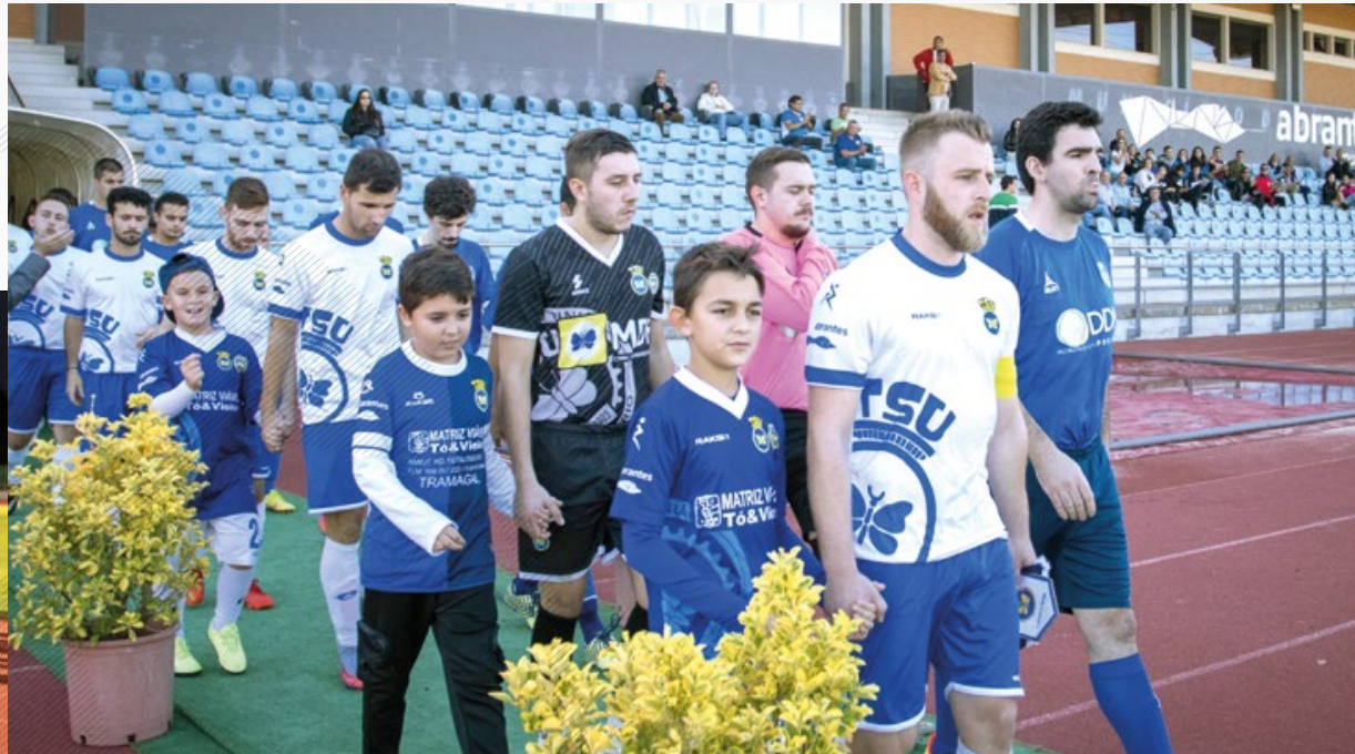
Grupo Desportivo Alcaravela

A final colocou frente a frente Alvega e Alcaravela, sendo que no final dos 80 minutos a equipa do Concelho de Sardoal levou a melhor e levantou o troféu. Os jogos decorreram entre 10 de setembro e 2 de outubro.