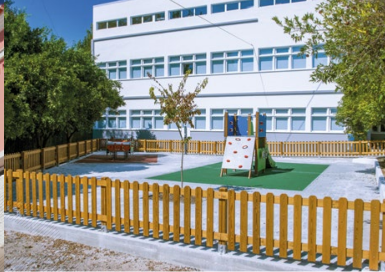
↑ Escola Básica de Alvega