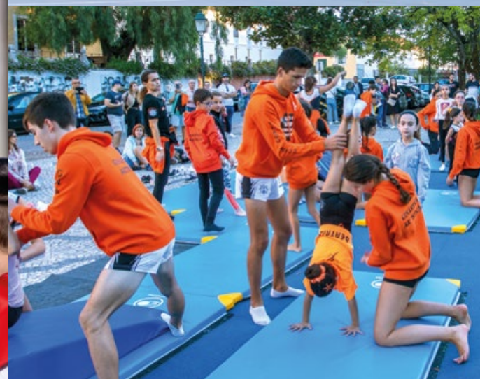
↑ Ginástica Artística Jardim da República