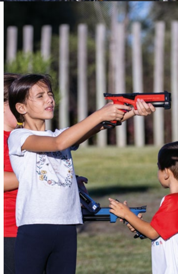
→ Laser Run, Orientação, Atletismo e Duetlo Parque Urbano de São Lourenço