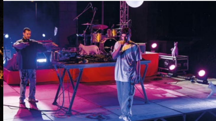
← BeatBros – Brains.&GomesZ