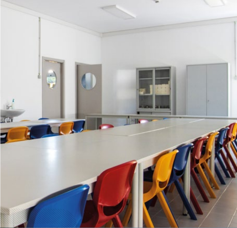
← Escola Básica de Alvega