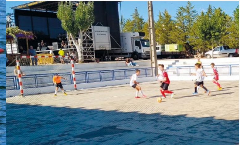
← Futsal Polidesportivo de Bemposta