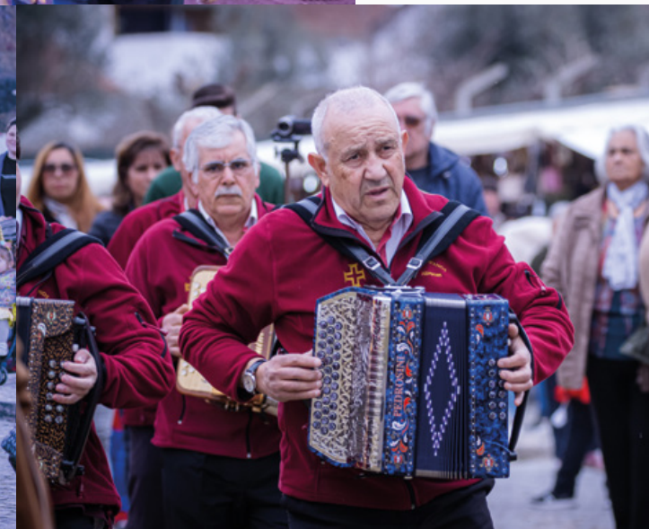
↑ Concertinas Sons Lusitanos