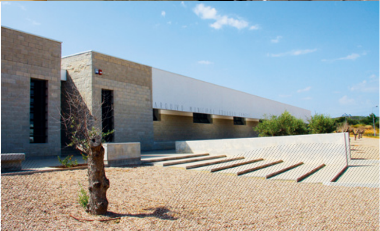
→ Fachada exterior do edifício