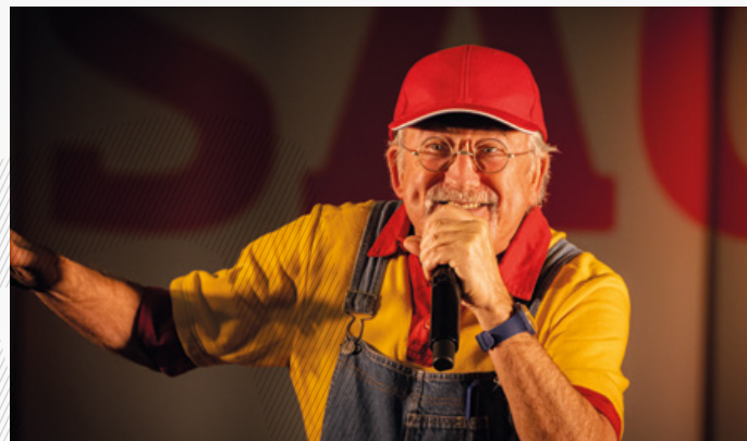
→ Avô Cantigas

A centenária Feira de S. Matias voltou a animar o Aquapolis Sul, em Rossio ao Sul do Tejo, de 17 de fevereiro a 5 de março, e este ano trouxe uma novidade: a Mostra de Atividades Económicas que teve como objetivo dar a conhecer os agentes empresariais e as suas empresas junto do público.