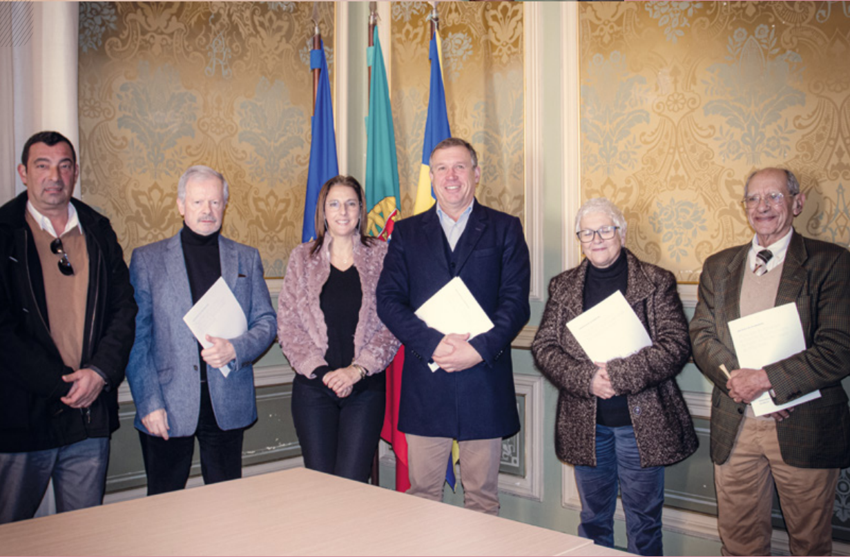
← Protocolo com o Centro Social Paroquial de Rossio ao Sul do Tejo