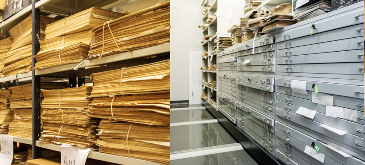
→ Zonas de arquivo