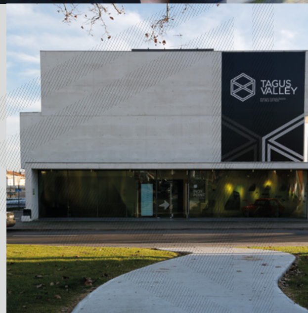
↓ Rui Brazão Poder dos comportamentos

É no Tagusvalley – Parque de Ciência e Tecnologia de Abrantes que encontramos a incubadora de empresas que tem atualmente disponíveis 28 lugares de cowork, dos quais 14 se encontram ocupados , mas com possibilidade de alargamento da oferta a mais 28 lugares. Um espaço de partilha e de desenvolvimento de ideias, produtos e serviços.