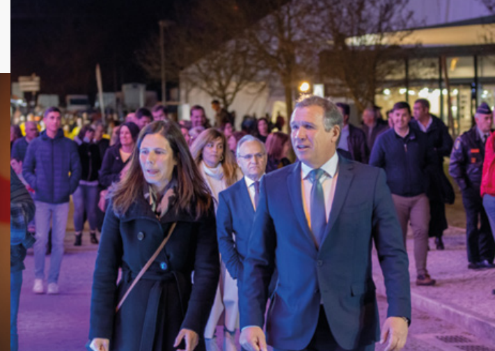
← Inauguração da Feira de S. Matias