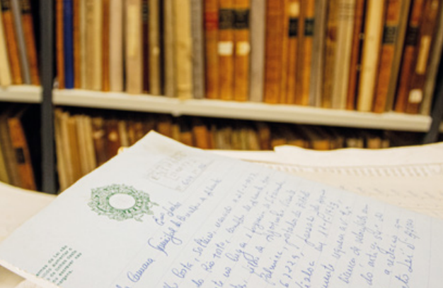
← Documento de arquivo