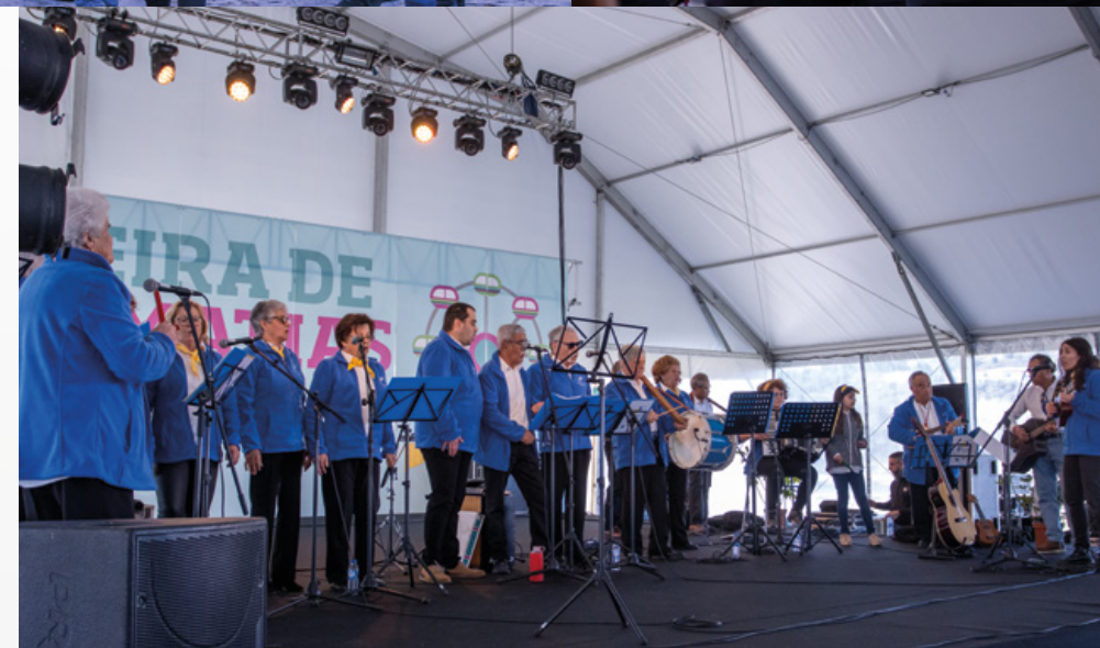
→ Brisas do Tejo