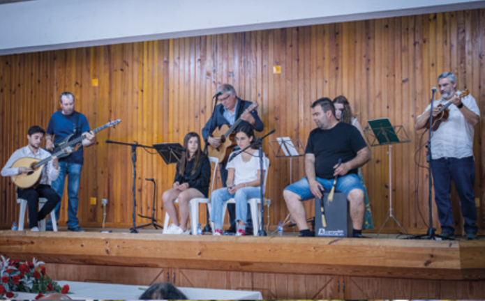
Trovas da Liberdade