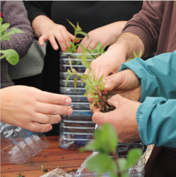
Projeto Encosta Viva

A incidir na urbanização da Encosta da Barata, com maior densidade populacional em Abrantes, esta candidatura, por parte dos 9 parceiros locais, teve por objetivo contribuir para a melhoria da qualidade de vida da comunidade residente, despoletando mecanismos de auto-organização na comunidade, procurando melhorar a visibilidade deste local, criar sentimentos de pertença, orgulho e interajuda por parte dos moradores, através da dinamização de atividades culturais, económicas, desportivas, recreativas e de saúde. Foram delineadas 4 ações em que foram realizadas um conjunto de atividades, sendo elas: “Pensar a Encosta” — diagnóstico participado de reflexão e auscultação daqueles que residem e intervêm no bairro, em que foram desenvolvidas 28 iniciativas, que mobilizaram mais 830 participantes; “Encosta Empreendedora” — procurar auxiliar pessoas em situações de vulnerabilidade económica a (re)definirem o seu percurso profissional, onde foram dinamizadas 6 ações, que procuraram ajudar 32 pessoas; “Encosta Saudável” — animação cultural, desportiva e recreativa de promoção de hábitos de vida saudáveis e combate ao isolamento, com 22 atividades realizadas, em que participaram mais de 662 pessoas; e “Encosta com Arte” — animação que visa proporcionar o acesso livre e gratuito à cultura, com 11 iniciativas em que participaram mais de 770 pessoas.