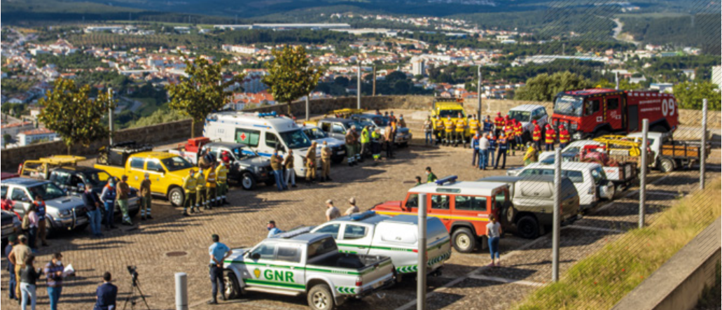
← Dispositivo Especial Contra Incêndios Rurais