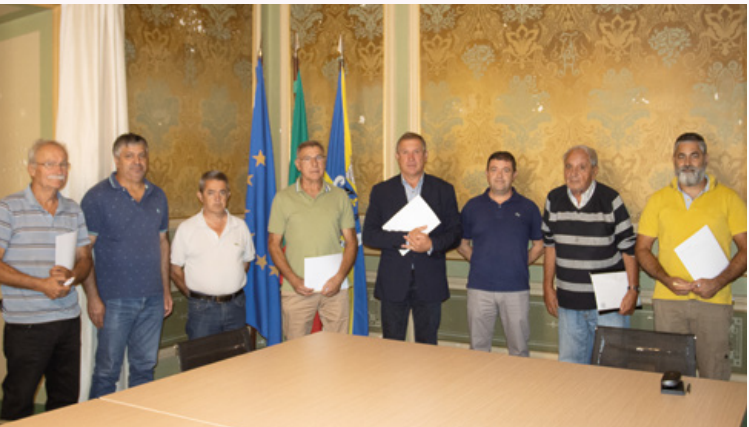
← Protocolos com Associações de Caçadores do concelho

Os kits são compostos por motobomba, carretel com mangueira e respetiva agulheta e tanque com capacidade de 500 litros de água, estando também apetrechadas com rádios de comunicação. Nos períodos de alerta laranja e vermelho, estão pré posicionados em Locais Estratégicos de Estacionamento (LEE), dentro do limite das respetivas freguesias.