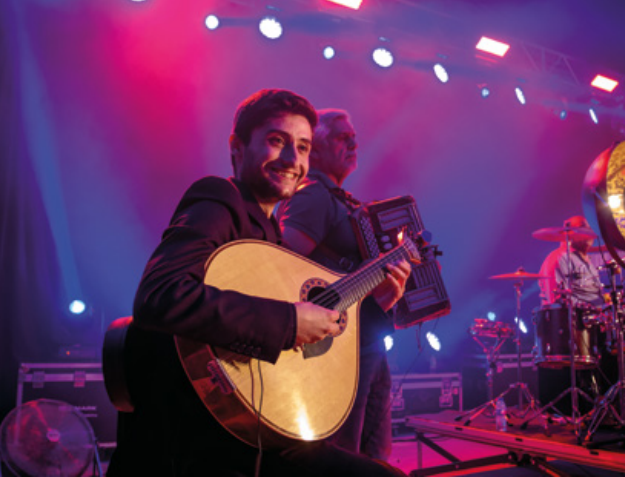
Trovas da Liberdade