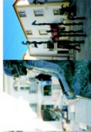
2 Laranjeira Santos