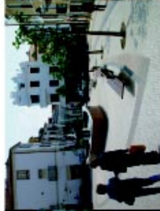
3 Largo Ramiro Guedes