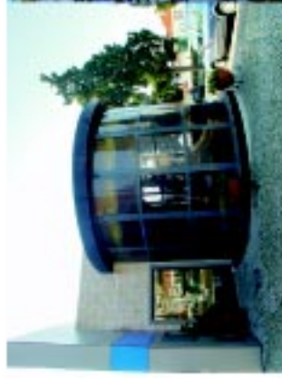
8 Posto de Turismo