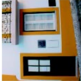
11 Seda da Ordem dos Arquitectos | Médio Tejo