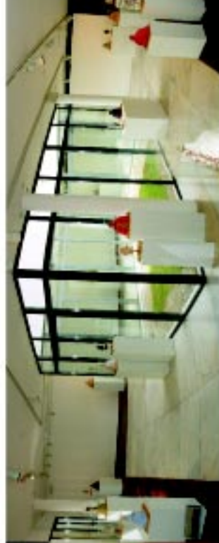
2 Galeria Municipal de Arte