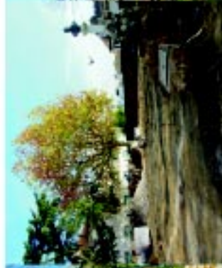
17 Jardim Actor Taborda [em requalificação]