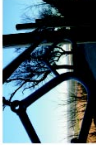
1 Circuito de Manutenção