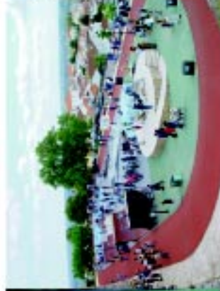
2 Parque Radical