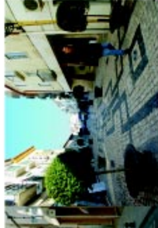
14 Rua N.ª Sr.ª da Conceição