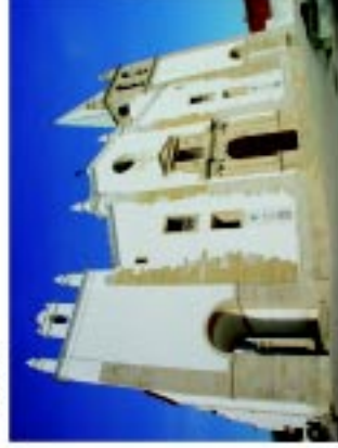
5 Igreja S. Vicente