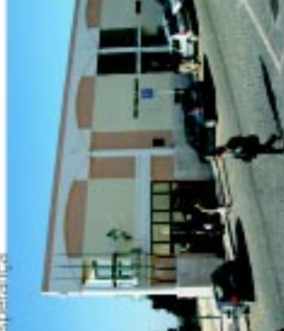
14 Grémio da Lavoura