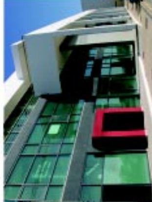
3 Junta de Freguesia de São João (nova)