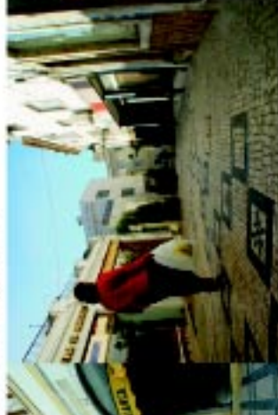
7 Rua Dr. Bernardino Machado