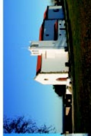
4 Igreja Sta Maria do Castelo