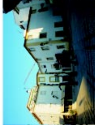
2 Largo João de Deus