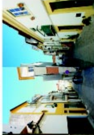
8 Rua Santa Isabel