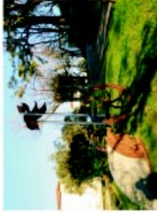
3b II Simpósio de Escultura em Ferro