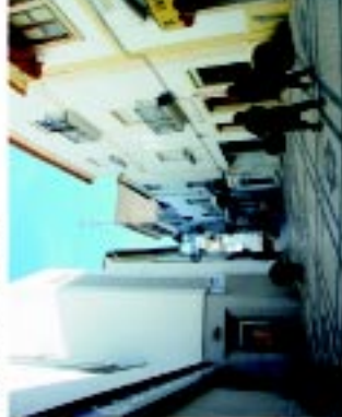
6 Rua Alexandre Herculanio