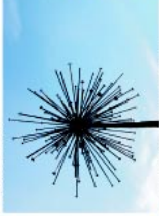
3a I Simpósio de Escultura em Ferro