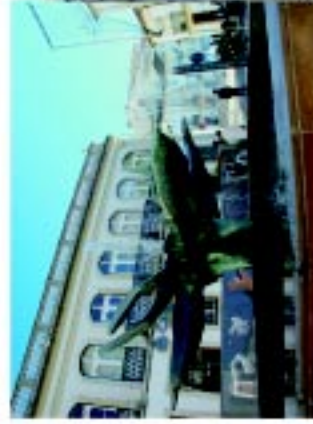
1 Oscar Guimarães