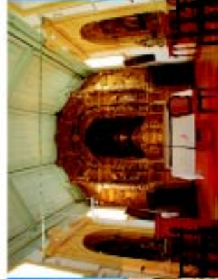
2 Igreja da Misericórdia