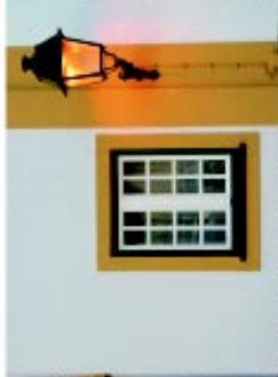
12 Arquitectura Vernacular