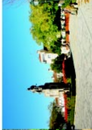
16 Jardim da Republica