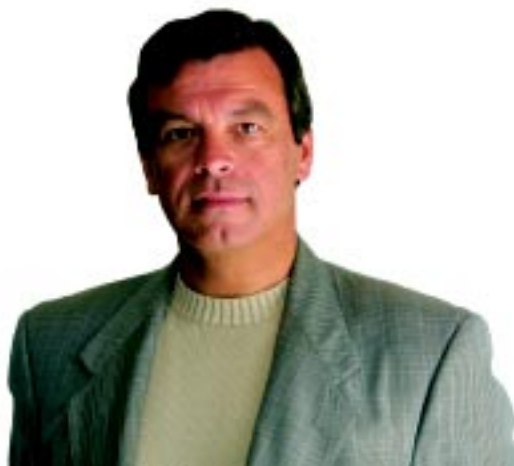
Nelson de Carvalho Presidente da Câmara Municipal de Abrantes