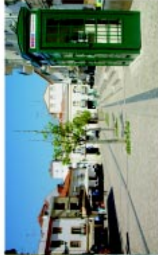
4 Praça Barão da Estalha