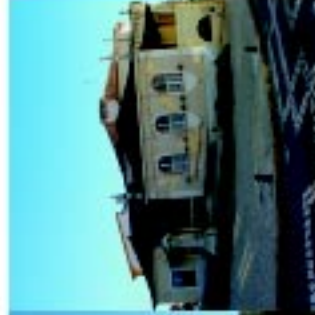
16 Assembleia de Abrantes