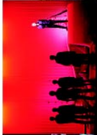
4 Biblioteca Municipal António Botto