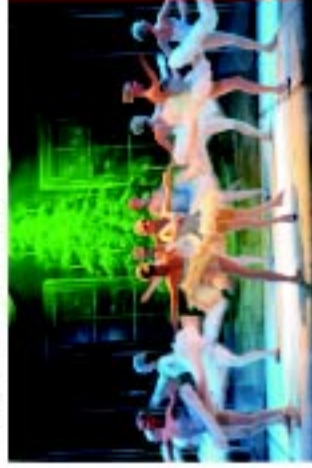
3 Cina Teatro S. Pedro