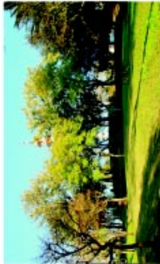
18 Parque do Alto de São António

Abrantes tem sido um exemplo a seguir por diversos municípios, que também dispõem de Centro Histórico, devido ao facto de ter vindo a desenvolver um trabalho muito sério e rigoroso em matéria de requalificação urbana.