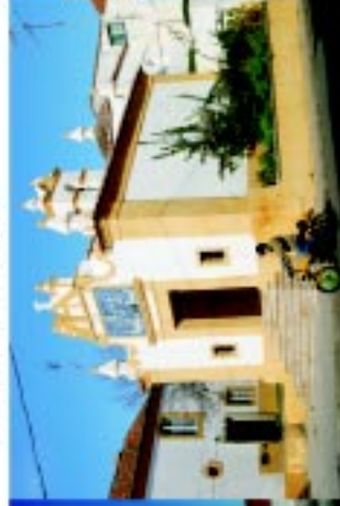
6 Capela Sant'Ana