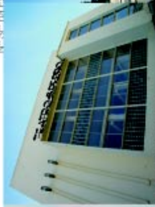
13 Cine Teatro S. Pedro