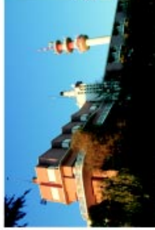
15 Hotel Turismo