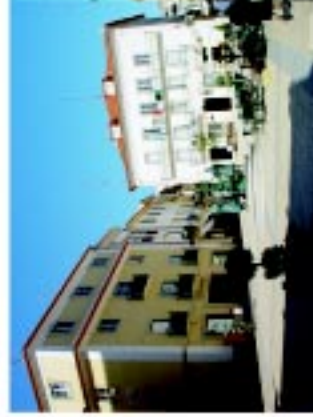
1 Praça Raimundo Soares