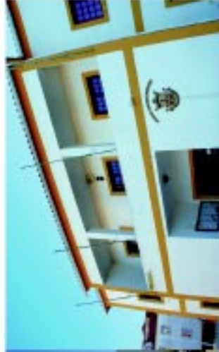
4 Junta de Freguesia de São Vicente