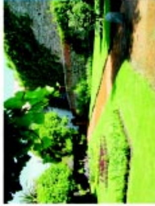
15 Jardim do Castelo