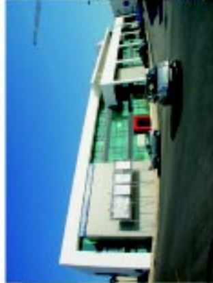
6 Edifício S. Domingos