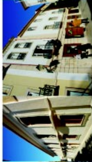
17 Edifício EDP

Edifício Milho Edifício do Benfica [em recuperação]