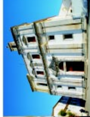
3 Igreja S. João Baptista