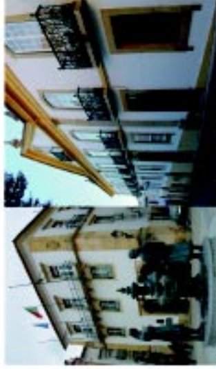
10 Casa da Câmara