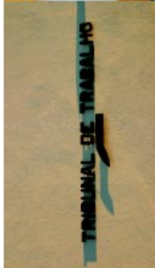
10 Tribunal de trabalho