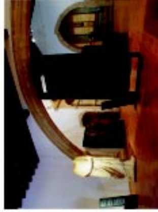
1 Museu D. Lopo da Almeida