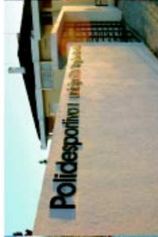
3 Polidesportivo Dr. Rogério Ribeiro