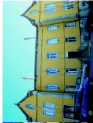
19 Edifício Camelo

Edifício Milho Edifício do Benfica [em recuperação]