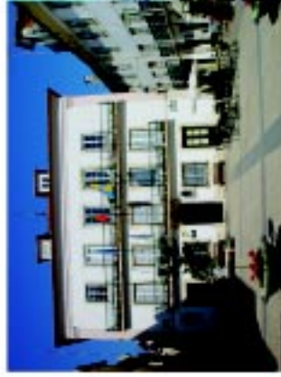
1 Câmara Municipal de Abrantes Clac Loja do Cidadão Banco do Tempo Provedor Municipal do Cidadão Nersant