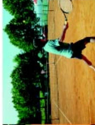
4 Campos de Ténis