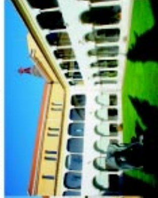
7 Convento de S. Domingos