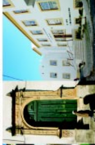
8 Convento N.ª S.ª da Esperança