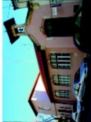
2 Serviços Municipalizados