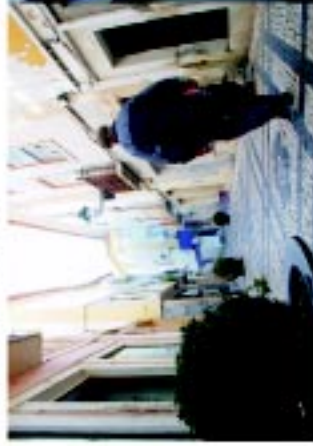
5 Rua Serpa Pinto