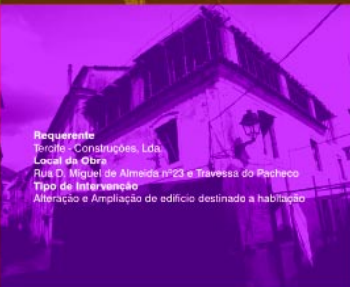
Requerente Tercife - Construções, Lda. Local da Obra Rua D. Miguel de Almeida nº23 e Travessa do Pacheco Tipo de Intervenção Alteração e Ampliação de edifício destinado a habitação