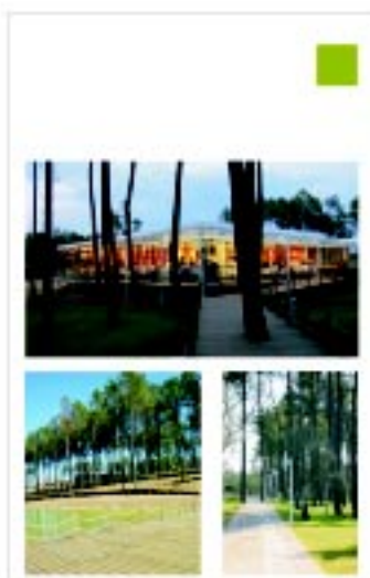
Parque Urbano de Abrantes São Lourenço