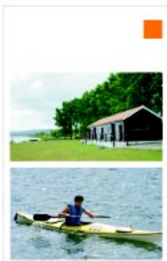
Estação de Canoagem de Alvega