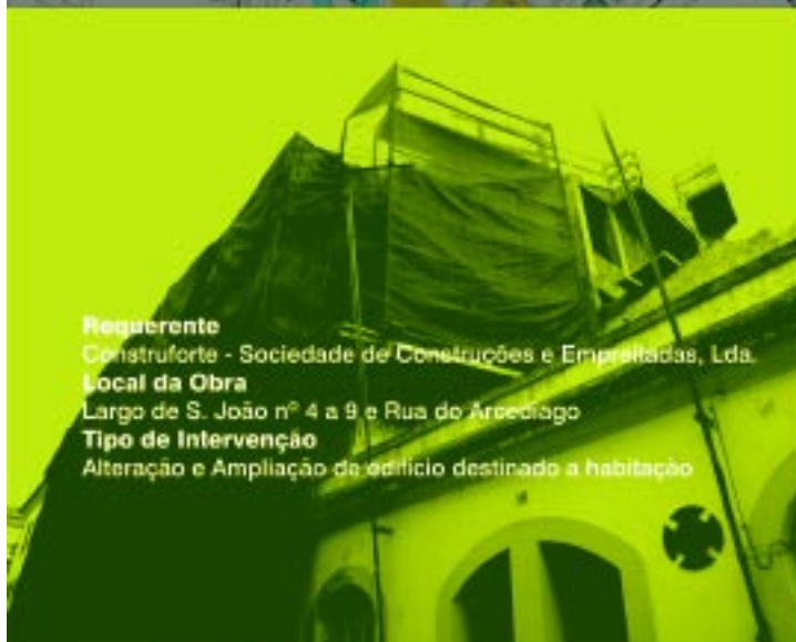
Requerente Construforte - Sociedade de Construções e Empreitadas, Lda. Local da Obra Largo de S. João nº 4 a 9 e Rua do Arcebispo Tipo de Intervenção Alteração e Ampliação de edifício destinado a habitação