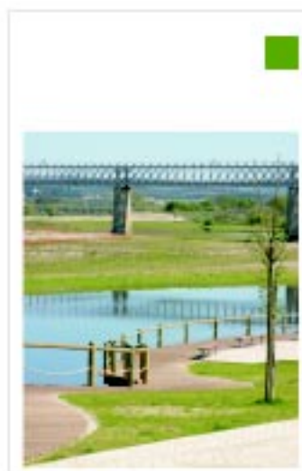
Parque Ribeirinho de Abrantes Aquapolis