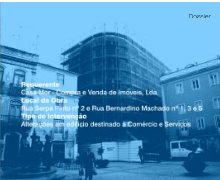
Requerente Casa Mor - Compra e Venda de Imóveis, Lda. Local da Obra Rua Serpa Pinto nº 2 e Rua Bernardino Machado nº 1, 3 e 5 Tipo de Intervenção Alterações em edifício destinado a Comércio e Serviços