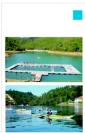
Parque Náutico de Aldeia do Mato