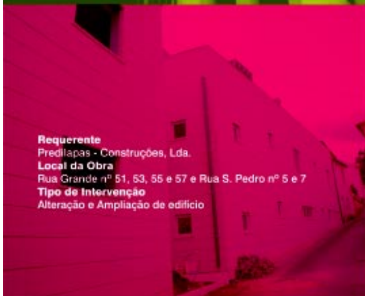
Requerente Predilapas - Construções, Lda. Local da Obra Rua Grande nº 51, 53, 55 e 57 e Rua S. Pedro nº 5 e 7 Tipo de Intervenção Alteração e Ampliação de edifício