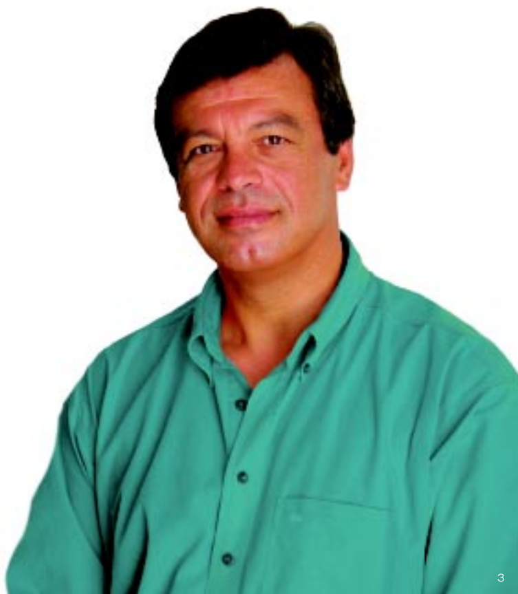
Nelson de Carvalho Presidente da Câmara Municipal de Abrantes