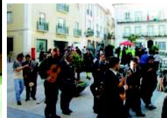
Dias Académicos animam Abrantes

Os Dias Académicos da Escola Superior de Tecnologia de Abrantes voltaram a animar a cidade entre os dias 17 e 20 de Maio. Os festejos tiveram início com a Noite de Serenatas no Castelo de Abrantes, com o grupo de fados "Sé Velha" e o grupo de serenatas da Faculdade de Motricidade Humana. A animação pela noite dentro ficou a cargo do DJ César.