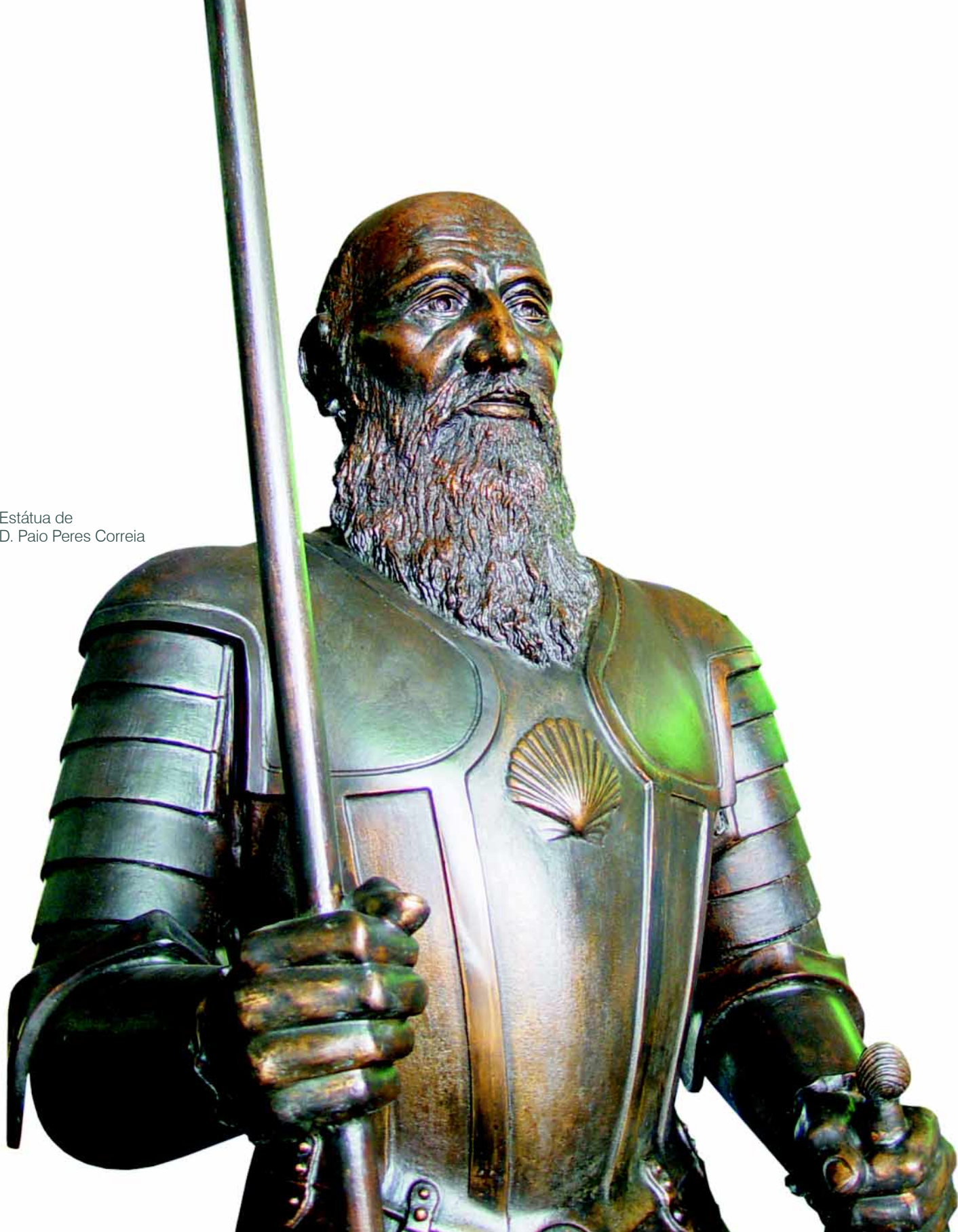
Estátua de D. Paio Peres Correia