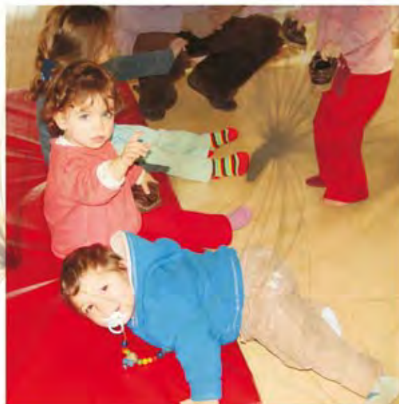
Visita a Instituições Sociais