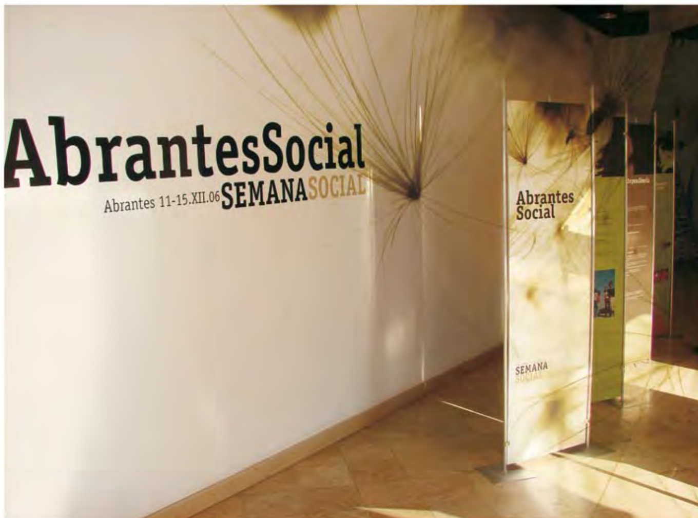
Exposição "Abrantes Social", Biblioteca Municipal António Botto