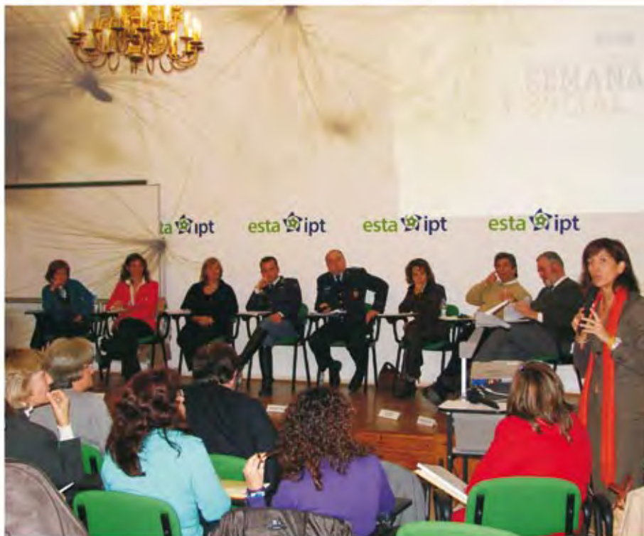
Entidades intervenientes no Processo de promoção e protecção de Crianças e Jovens, ESTA