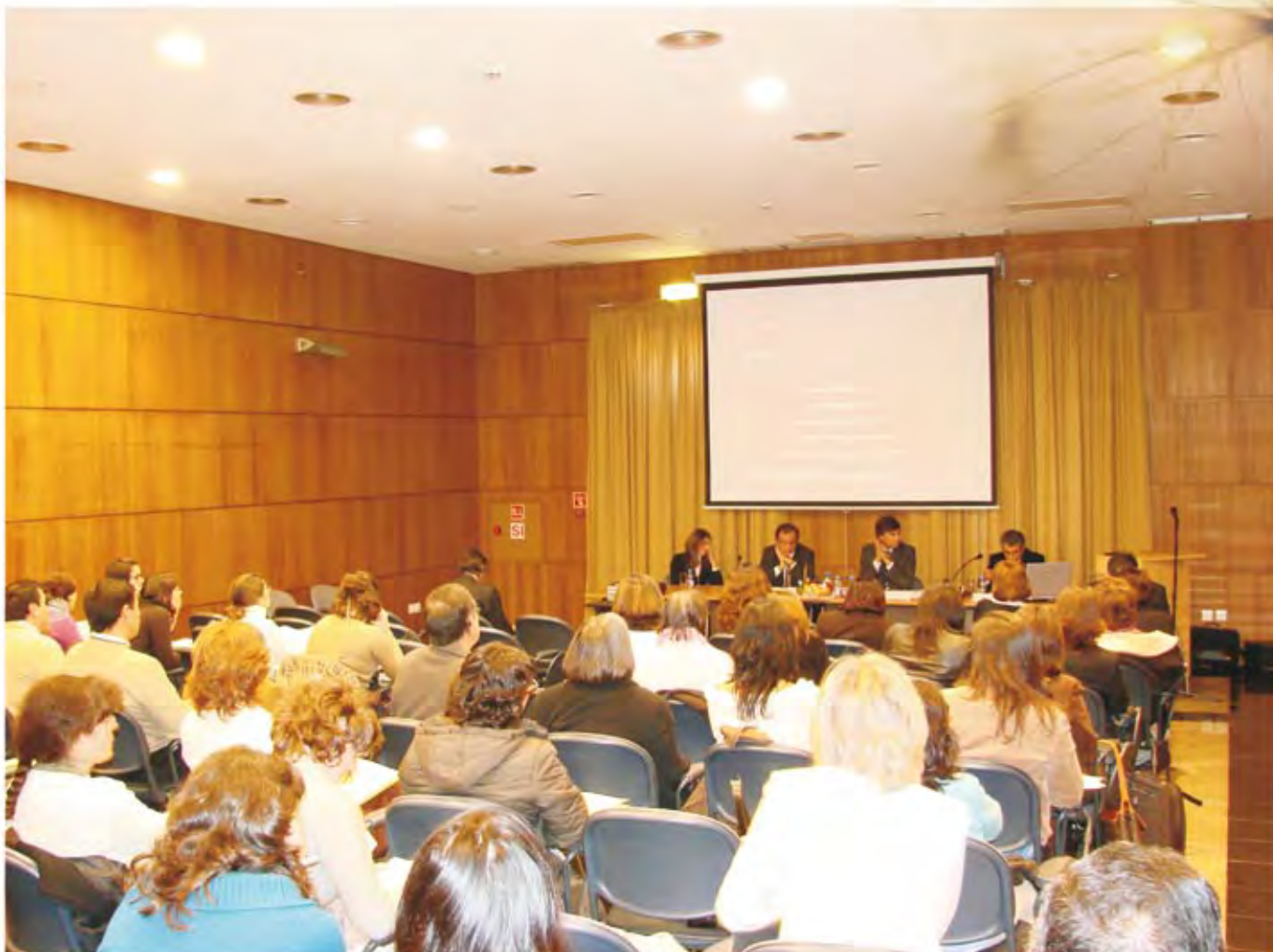
Seminário "Redes e Parcerias", Edifício Pirâmide