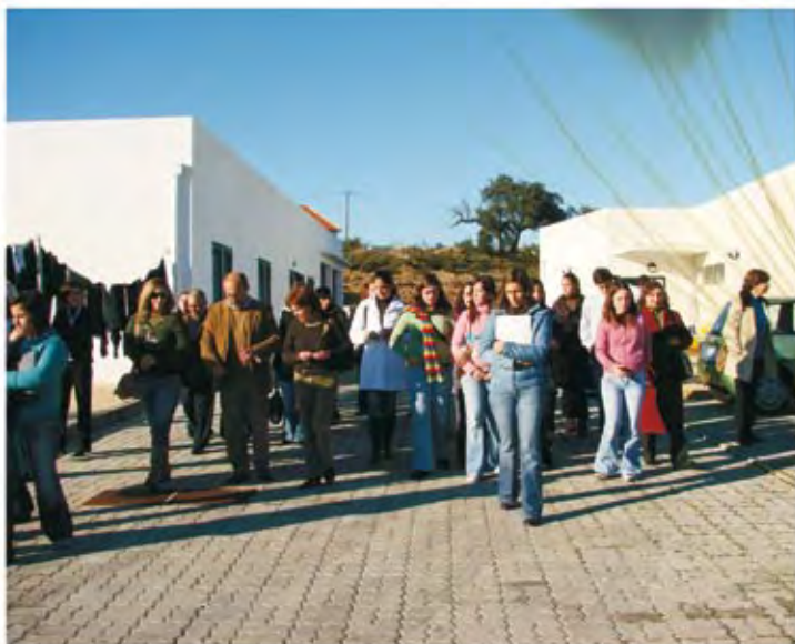
Visita a Instituições Sociais