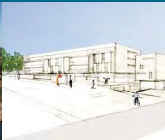
Mercado Diário em projecto