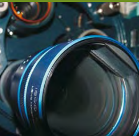
Vídeo e Cinema Documental na ESTA

Os interessados podem consultar o Regulamento na página da Câmara em www.cm-abrantes.pt ou no site http://www.grupolena.pt/engenho_arte/