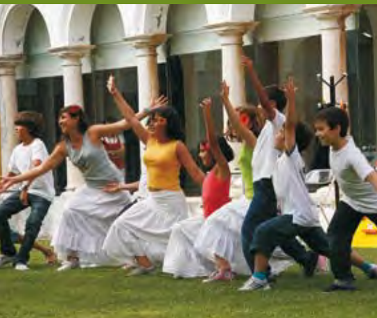
Dia dos Avós

Cento e oitenta crianças do Concelho participaram este ano neste programa de ocupação dos tempos livres, nas férias de Verão, promovido pela Divisão de Desporto da Autarquia. Os jovens, sempre acompanhados por monitores, participaram em mais de 20 actividades: Natação, Hidroginástica, Basebol, Basquetebol, Râguebi, Xadrez, Futsal, Jogos Tradicionais, BTT, Tiro com Arco, Equitação, Ginástica, Atletismo, Jogos Aquáticos, Visualização de Filmes, Futebol 7, Futebol de Praia, Beach Rugby, Pesca, Canoagem, idas à praia e outras actividades.