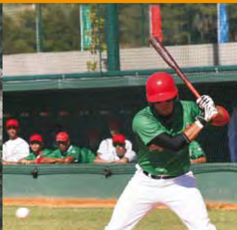
Basebol é em Abrantes

O atleta do Sporting de Abrantes, conseguiu a única vitória individual para os clubes ribatejanos que participaram no Campeonato Nacional de Juvenis, em Atletismo, nos dias 28 e 29 de Junho. O jovem atleta não se ficou pela vitória e com a marca de 64 metros e 75 centímetros bateu também o recorde nacional do lançamento do dardo. Estiveram presentes nesta competição, que decorreu na pista de atletismo da Cidade Desportiva, 789 atletas em representação de clubes de todo o país.