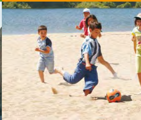
Verão com muita actividade