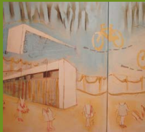
Trabalho a concurso na edição de 2007