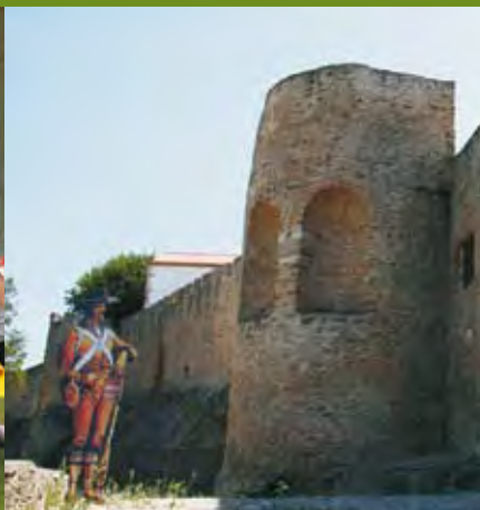
Castelo/Fortaleza de Abrantes