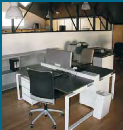
Mercado do Escritório

A empresa de design de interiores, “Rigor de Espaços” inaugurou as suas instalações em Abrantes, na rua da Indústria - Chainça. As novas instalações resultaram da remodelação de um antigo armazém e vão servir igualmente de show room para a empresa “Mercado do Escritório”. Estão também disponíveis os sites das duas empresas, nos endereços www.rigordeespacos.pt e www.mercadodoescritorio.pt , onde podem ser encontrados alguns exemplos de remodelações de zonas de trabalho e proposta de mobiliário para escritórios, instituições públicas, auditórios, escolas, entre outros. Na apresentação estiveram presentes o deputado Nelson Baltazar, a vereadora Maria do Céu Albuquerque, o administrador delegado da Tejo Energia, Paulo Almirante, representantes da Tagus, da Tagus Valley, administradores do Grupo Mendes e da Soladrilho, entre outros.