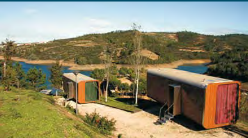
► BUNGALOWS DA PRAIA FLUVIAL DE ALDEIA DO MATO, ESTAÇÃO DE CANOAGEM DE ALVEGA E FEIRA NACIONAL DE DOÇARIA TRADICIONAL