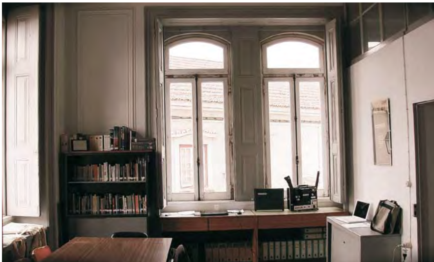
► A SEDE DA FEDERAÇÃO PORTUGUESA DE CINECLUBES, NO EDIFÍCIO CARNEIRO