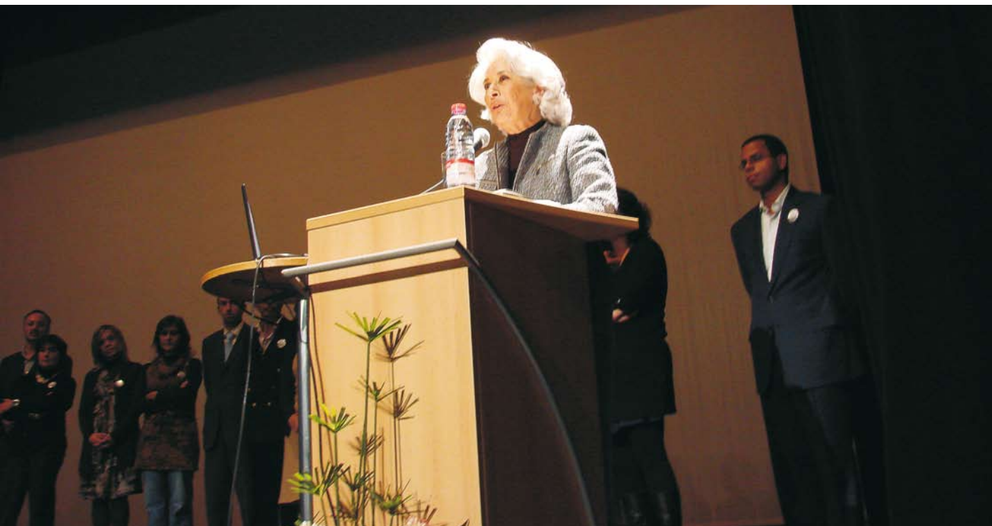
► "UM DIA PELA VIDA" É UM MOVIMENTO DA LIGA PORTUGUESA CONTRA O CANCRO