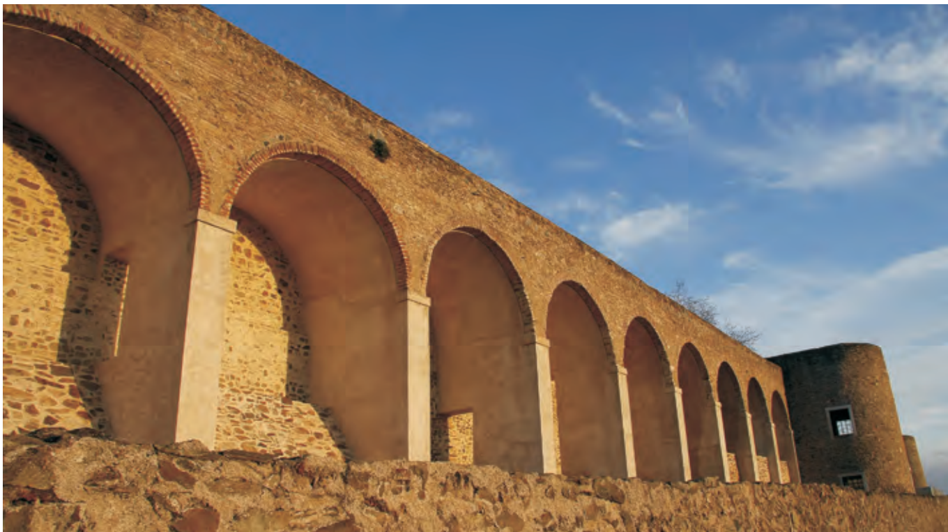
► CASTELO/FORTALEZA DE ABRANTES