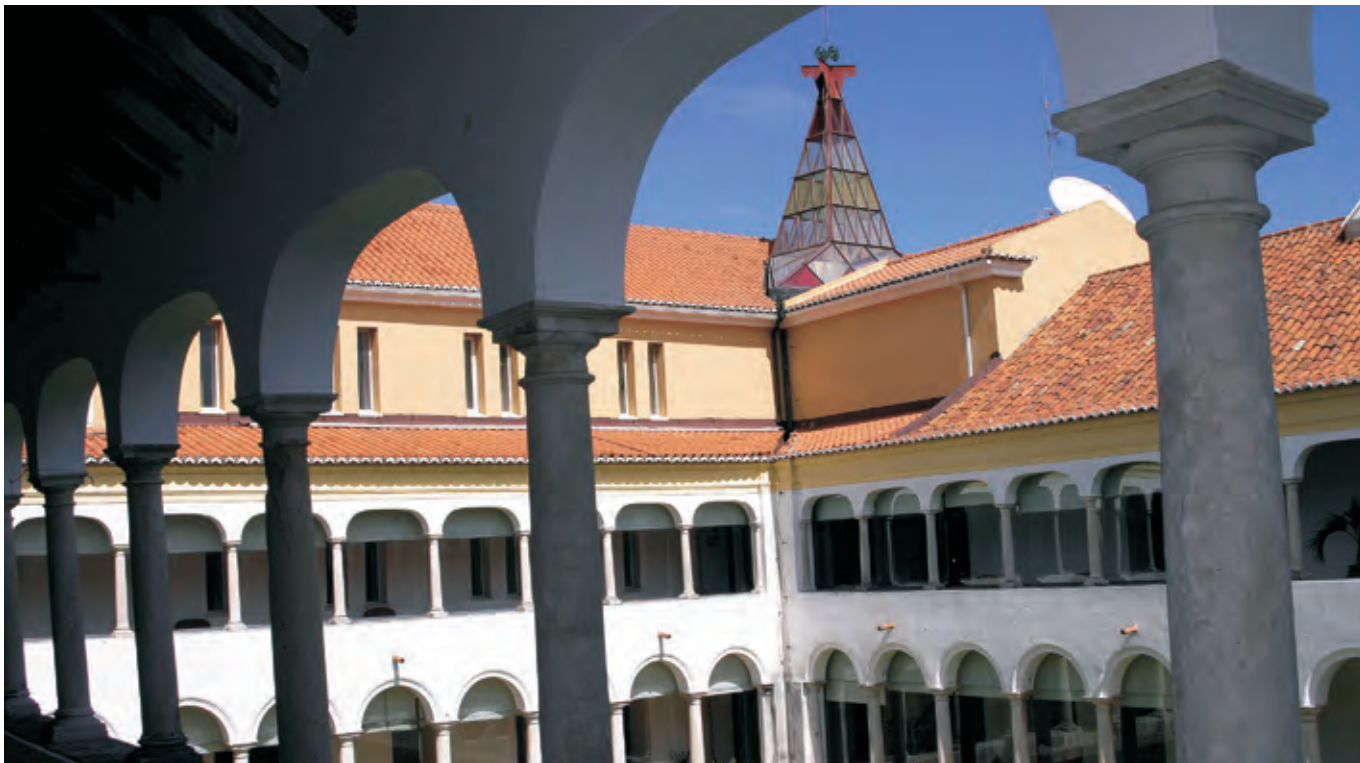
► BIBLIOTECA MUNICIPAL ANTÓNIO BOTTO