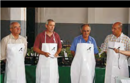
► NÚCLEO DE PRODUTORES DO RIBATEJO INTERIOR

tem acesso à Internet. Tenho divulgado junto de amigos e conhecidos. Recomendando-lhes que se inscrevam e que venham buscar este pedaço de terra, de coisas que nascem dela.