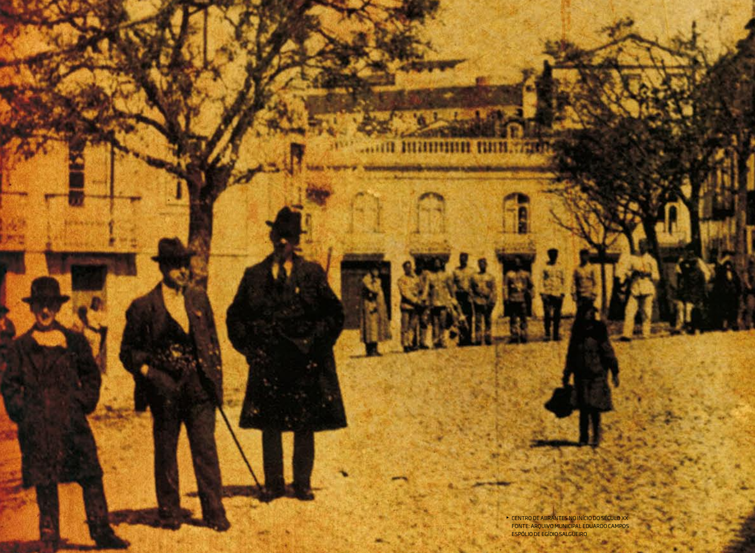
► CENTRO DE ABRANTES NO INÍCIO DO SÉCULO XX