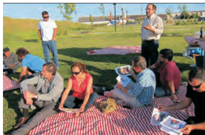
18/JUNHO LOCAL: AQUAPOLIS SUL